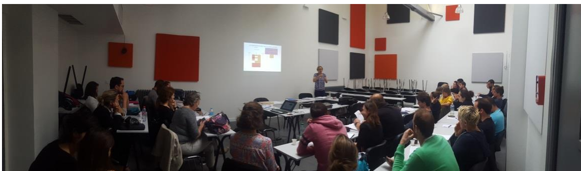
Stage PPCR dans la salle de réunion rénovée du SNEP au 76 rue des Rondeaux

De l'avis de toutes et tous, une nouvelle journée d'information semble nécessaire durant le premier trimestre 2017/2018.